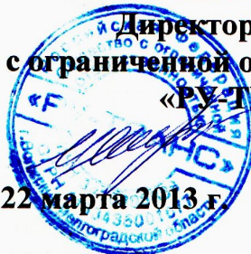
График работы общества с ограниченной ответственностью «РУ-ТРАНС»

УТВЕРЖДАЮ Директор общества с ограниченной ответственностью «РУ-ТРАНС» И.Микульчин 22 марта 2013 г.